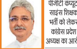
साइंस शिक्षक भर्ती ने हरियाणा सरकार और हरियाणा लोक सेवा आयोग (एचपीएससी) की कार्यप्रणाली पर गंभीर सवाल खड़े कर दिए हैं। 1711 पदों के लिए आयोजित भर्ती प्रक्रिया में महज 39

पीजीटी कंप्यूटर साइंस शिक्षक भर्ती को लेकर हरियाणा काँग्रेस प्रदेश अध्यक्ष राव नरेंद्र सिंह ने तीव्र प्रतिक्रिया व्यक्त की। उन्होंने कहा कि इस भर्ती प्रक्रिया में 1711 पदों पर सिर्फ 39 हरियाणा के युवा चयनित किए गए। उन्होंने एचपीएससी पर हरियाणवी युवाओं को जानबूझकर बाहर करने का आरोप लगाया। उन्होंने कहा कि पीजीटी कंप्यूटर