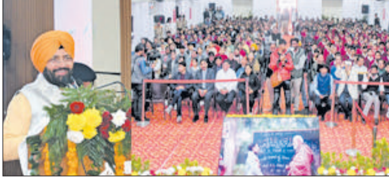
कैथल। परीक्षा पे चर्चा को लेकर राज्यस्तरीय कार्यक्रम में उपस्थित विद्यार्थियों को संबोधित करते हुए मुख्यमंत्री नायब सिंह सैनी।

मुख्यमंत्री नायब सिंह सैनी ने शुक्रवार को शिक्षा निदेशालय द्वारा आरकेएसडी कॉलेज कैथल के सभागार में आयोजित परीक्षा पे चर्चा कार्यक्रम में बतौर मुख्य अतिथि शिरकत की। उन्होंने विद्यार्थियों के साथ प्रधानमंत्री नरेंद्र मोदी के एजाम वॉरियर्स विशेष एपिसोड के लाइव प्रसारण देखा। इसके उपरांत मुख्यमंत्री ने कक्षा 9वीं से 12वीं के विद्यार्थियों, शिक्षकों और अभिभावकों को संबोधित करते हुए उनका मनोबल बढ़ाया। मुख्यमंत्री ने बच्चों को परीक्षा का दबाव न लेने का आह्वान करते हुए कहा कि परीक्षा आपकी पहचान नहीं बल्कि परीक्षा के लिए किए गए आपके प्रयास, मेहनत व सोच ही आपकी असली पहचान है। मुख्यमंत्री ने कहा कि आज हम सबने परीक्षा पर चर्चा कार्यक्रम में भाग लिया और प्रधानमंत्री नरेंद्र मोदी के संदेश को सुना। प्रधानमंत्री जी ने परीक्षा के दौरान विद्यार्थियों के मन में उठने वाले डर और तनाव को लेकर एक बहुत ही महत्वपूर्ण और प्रेरणादायक संदेश दिया। प्रधानमंत्री नरेंद्र मोदी हर वर्ष बच्चों की परीक्षाओं से पहले उनसे जुड़कर चर्चा करते हैं। आज भी उन्होंने परीक्षा के अलावा विकसित भारत, स्वच्छता एवं कर्तव्य पालन को लेकर विद्यार्थियों से बातचीत की और इन सभी विषयों में अपनी भागीदारी सुनिश्चित करने का आह्वान किया।