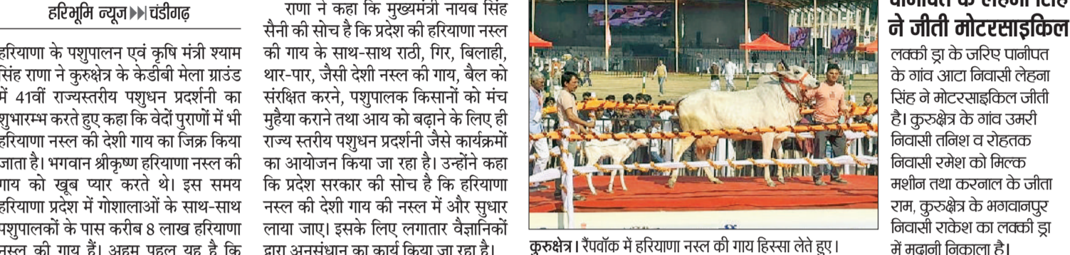
कुरुक्षेत्र। रैंपवॉक में हरियाणा नस्ल की गाय हिस्सा लेते हुए।