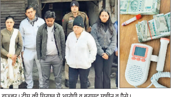
झज्जर। टीम की गिरफ्त में आरोपी व बरामद मशीन व पैसे।