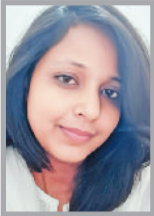
(लेखक रश्मीआई में एजीएम हैं, ये उनके अपने विचार हैं।)