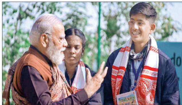
पीएम ने छात्रों को परीक्षा को बोझ नहीं, बल्कि सीखने के एक अवसर और उत्सव के रूप में देखने का संदेश दिया

इस पहले से अब तक 4.5 करोड़ से अधिक छात्र, शिक्षक और अभिभावक जुड़ चुके हैं, जिन्होंने माय गाँव पोर्टल के माध्यम से पंजीकरण कराया